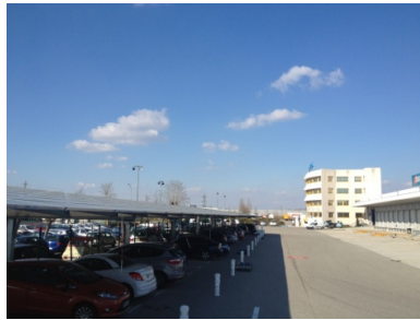
Centrale du Pontet